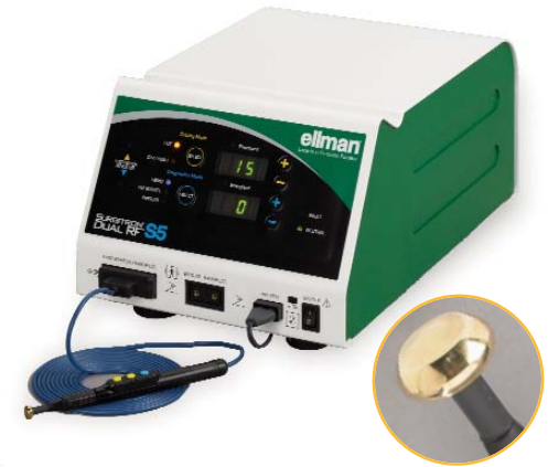
Générateur Surgitron Dual S5 avec accessoire Pellevé