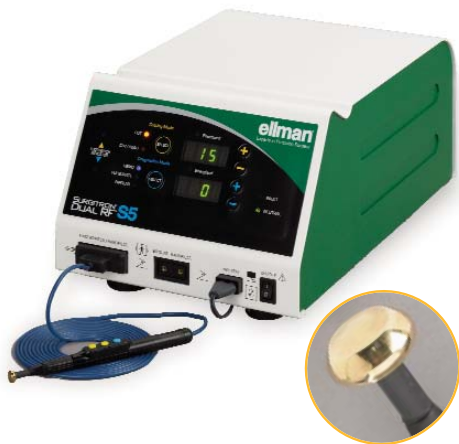
Générateur Surgitron Dual S5 avec accessoire Pellevé

Surgitron® Dual RF™ S5 délivre une énergie contrôlée qui permet un geste précis pour le traitement Pellevé mais aussi dans d'autres indications chirurgicales en ORL, dermatologie, Ophtalmologie... La radiofréquence Ellman est le générateur idéal pour les cabinets et les cliniques.