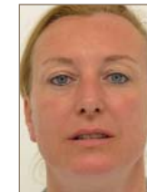
Après 6 mois